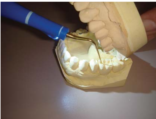
Monomon moonmo monon

Introduz um novo conceito de iluminação intra-oral e conforto para o profissional.